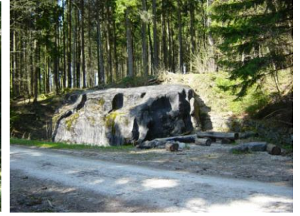
Titistei ob Eichberg / Seengen